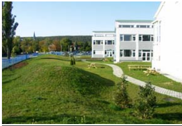
Lycée Gustave Eiffel de Budapest

Adresse courrier : l.f.b@t-online.hu Site Internet : www.lfb.hu