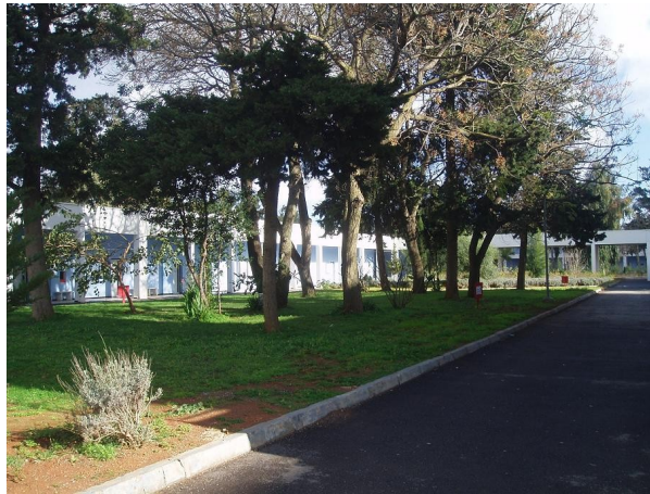
Devant le C.D.I. D.Schneider. 01-2010 .

Bien que nous ayons quatorze et quinze ans, nous sommes conscients de l'importance des droits des hommes et de la défense de la liberté et de la fraternité entre les peuples.