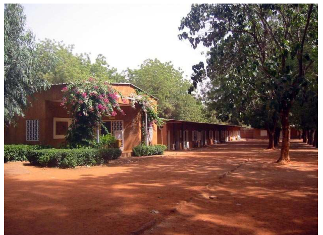
Lycée Français La Fontaine.