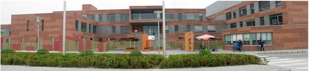
Lycée Français de Shanghai, Chine

Image prise du site officiel du Lycée Français de Shanghai